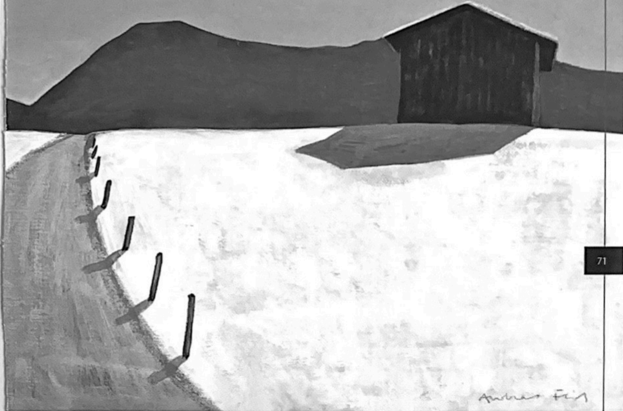
Stadel im Gegenlicht, verschneit

In das harmonische, großflächige Farbenspiel dieser Bilder taucht der Betrachter nur allzu gerne ein. Vielleicht, um selbst zur Ruhe zu finden? Feils Bilder sind gegenständlich, aber nicht realistisch. Der Künstler stellt uns ideale Landschaften vor – nicht solche, die wir täglich sehen, sondern die wir gerne sehen würden. Die Farbigkeit ist reduziert, gleißende Sonnenstrahlen gibt es nicht. „Seit über drei Jahrzehnten beschäftige ich mich mit der Idee der idealen Landschaft als Ruhepol für den modernen Menschen“, berichtet Andreas Feil, für den viele