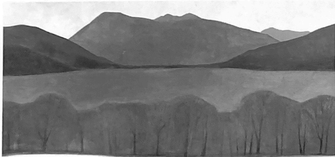
Der erste Schnee

Bei der Finissage seiner Ausstellung in der Rottach-Egerner Galerie Hyna am 19. November 2017 feiert er seinen 50. Geburtstag – zusammen mit der namhaften Galerie, die derzeit ihr 50jähriges Jubiläum feiert.