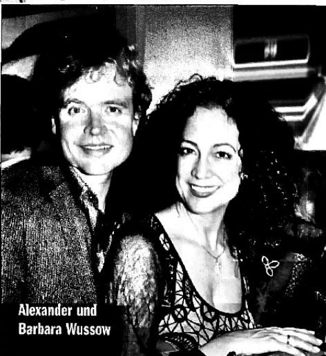
Alexander und Barbara Wussow