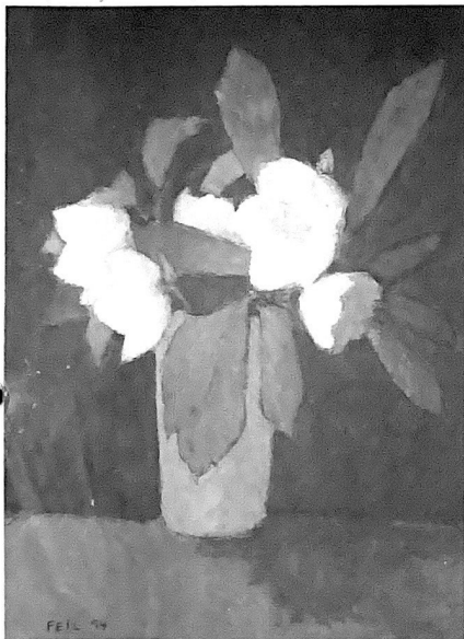
1994, Öl auf Leinwand, 40 x 30 cm