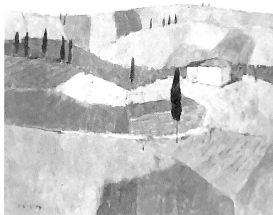
1994, Öl auf Leinwand, 50 x 60 cm