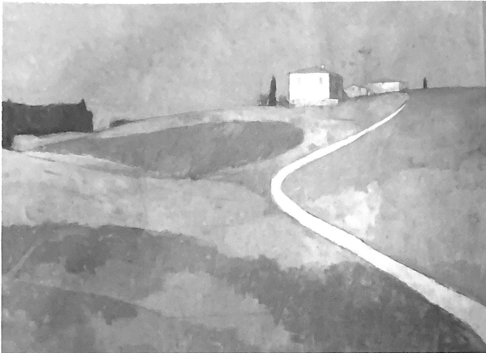
1994, Öl auf Leinwand, 90 x 110 cm